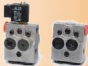
DELTA-Brennstoffpumpe Typ A, AD Pumpenleistung bis 50l/h (bei 10 bar)

Wir vertreiben alle Produkte der Fa. DELTA