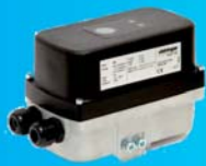
ELEKTROGAS Servomotor Typ MZ zur Steuerung der Drosselklappen