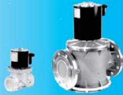
ELEKTROGAS Magnetventile Typ VMR/VML RP 1/4" - DN 150

Wir vertreiben alle Produkte der Fa. ELEKTROGAS