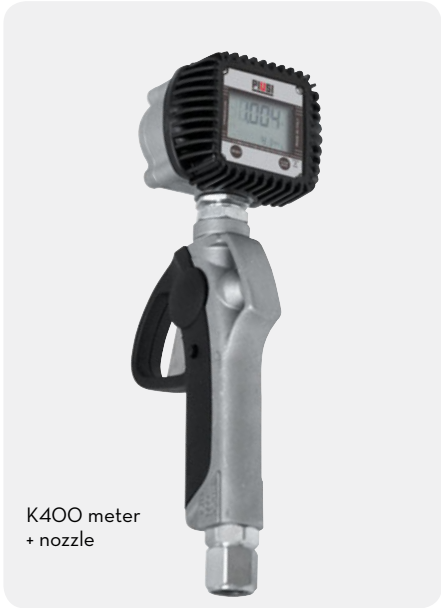
K400 meter + nozzle