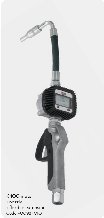
K400 meter + nozzle + flexible extension Code F00984010