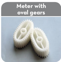
Meter with oval gears