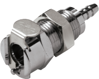
Plattenmontage Schlauchtülle, gerade

*Schlauchinnen- und -außendurchmesser beachten!