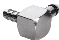
Winkelstecker Schlauchtülle, gerade

*Schlauchinnen- und -außendurchmesser beachten!