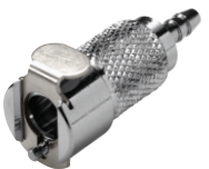
In-Line Schlauchtülle, gerade

*Schlauchinnen- und -außendurchmesser beachten!